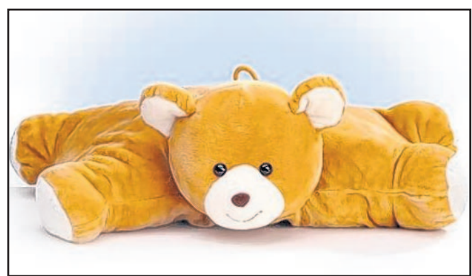
Drei Motive gibt es als wärmendes Kuschelkissen – der Bär

Auch für die medizinische Seite bürgt er. Die Wärmflaschen erfüllen höchste Sicherheitskriterien hinsichtlich Material und Qualität. Gemäß den Richtlinien für die EU-