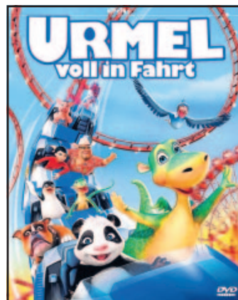
Urmel im hippen Digitallook

DVD: „Urmel voll in Fahrt“ fünfmal zu gewinnen