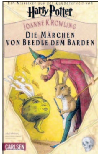
„Harry Potter“ online geschenkt

Diese Erfahrung machen sich die Verantwortlichen der Stiftung Lesen zu nutze. Sie haben bundesweit eine