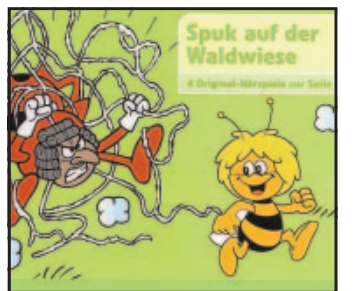
Die Biene Maja als Hörspiel-CD

Natürlich sind auch die beliebten Original-Stimmen der Kinderserie mit dabei. Untermalt wird das Gan-