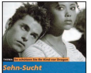
Suchtratgeber der Polizei

Die Infobroschüre „Sehn-Sucht“ der Polizei will Eltern und Jugendlichen helfen. Ihr Ziel: „Der Schutz des Kinds vor Drogen“. Sucht wird ausführlich beschrieben. Außer einigen Gefahrensignalen, beispielsweise Passivität und Unselbstständigkeit, überzogene Leistungsanforderungen an sich selbst oder die Unfähigkeit Konflikte durchzustehen, werden auch noch legale (Medikamente, Nikotin, Alkohol) und ille-