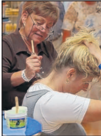
Wohlfühlen, darum geht's

Immer mehr Menschen sind auf der Suche nach innerer Zufriedenheit, Wohlbefinden und Gesundheit. Wellness boomt! Die „Deut-