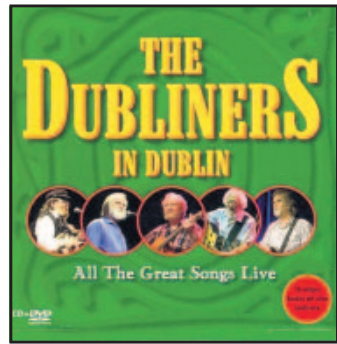
Die großartigsten Songs

VERLOSUNG: „All The Greatest Songs“ der Dubliners