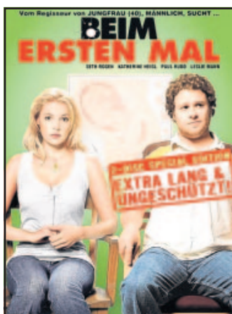
Die DVD gibt's bei uns geschenkt

Schockschwerenot! Schwanger? Mit einem Baby? Von dem bisschen One-Night-Stand? Für TV-Karriereschönheit Alison (Katherine Heigl) ist diese Horravorstellung wahr geworden. Eine Beförderung und etwas zu viel Alkohol tragen dafür Sorge, dass sie sich zur ungeschützten Unterleibseröffnung mit dem Kifferchaoten Ben (Seth Rogen) hinreißen lässt. Das böse Erwachen folgt für die beiden Ungleichen acht Wochen und einen Schwangerschaftstest später. Volltreffer! „Beim ersten Mal“ (Universal Pictures). Man trifft sich unverhofft zum zweiten Date. Und beschließt, sich zu arrangieren.