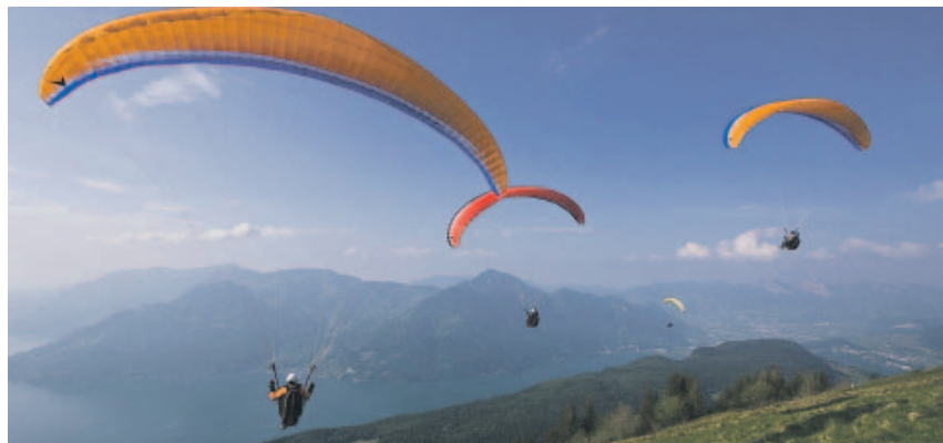
Abheben mit dem „Wochenblatt“ auf der „Horizont“ im Februar