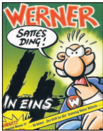
„Werner“, die neue DVD-Box

Was haben wir nicht gelacht, mit und über „Werner“ – und über seine Zeichentrickfreunde sowie seine Comic-Kontrahenten. Auf Papier, auf Leinwand, auf Mattscheibe, niemand konnte „Werner Brösel“