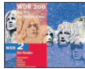
„Die besten Songs“ auf einer CD

Auf der Doppel-CD sind weltweit bekannte Songs wie „Urgent“ von Foreigner oder „Samba Pa Ti“ von Santana enthalten. Insgesamt sind es 30 Lieder, die jeder kennt und schon mal irgendwo gehört hat.