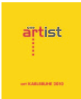
Katalog der „one-artist“-Shows der Kunstmesse

Einer der Schwerpunkte ist die vielköpfige Berliner Kunstszene. Darunter ist aber auch Kunst aus Südafrika sowie Videokunst in zwei Sonderausstellungen vom 4. bis 7. März in der Messe Karlsruhe. Gerne sehen sie die große