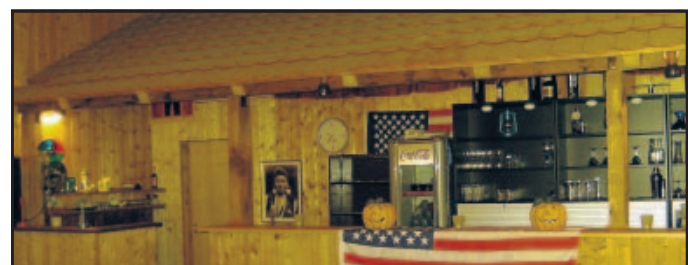
An der Bar im „Saloon“ vom Restaurant „Grand Canyon“.

Sind die Steaks Schwerpunkt der Speisekarte, so darf man Angebote wie das American Breakfast Buffet mit Wurst und Käse, Pancake, Eggs & Bacon inklusive Orangensaft und Kaffee (jeden Sonntag von 10 bis 12 Uhr) oder die verschiedenen Themen- und Buffet-Veranstaltungen nicht vergessen. In den zurücklie-