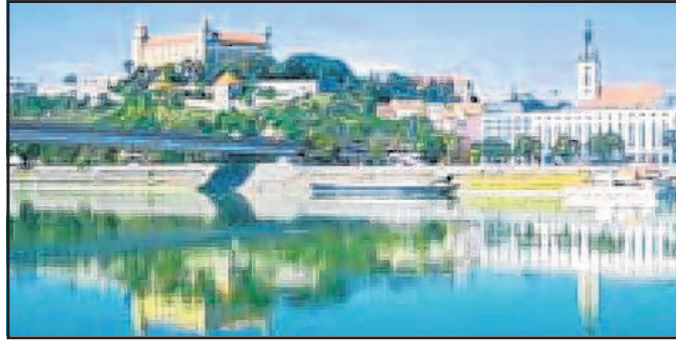
Die Donau und ihre Ufer bei den Landgängen im April entdecken

Die Kreuzfahrt für „Wobla“-Leser/innen geht von Passau über