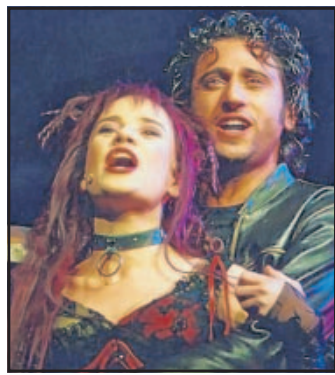
Szene aus „We Will Rock You“