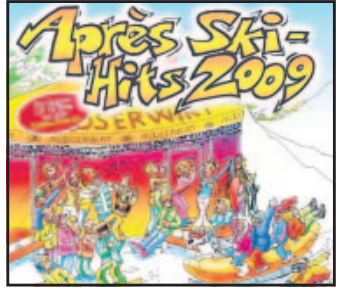
Neue Doppel-CD für Pistenhasen

Was für die einen zu einer gelungenen Pistengaudi gehört, genießen andere während der heißen Faschingsphase: Schlagerkracher.