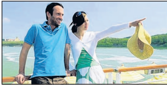
Reisen mit dem Schiff: Genuss und Luxus

Wien mit Führung. Am vierten Reisetag steht eine Stadtrundfahrt in Budapest auf dem Programm und am fünften Tag ein Besuch der Puszta und in Kecskemet. Ein Stadtrundgang in Bratislava ist für den sechs-