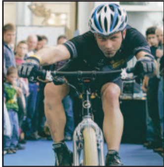
Sportlich auf zwei Rädern

Mehr Informationen zur Messe sind online auf www.fahrradmarkt-zukunft.de , www.kmkg.de oder unter der Rufnummer 0721 3720 2143 zu finden. (grz)