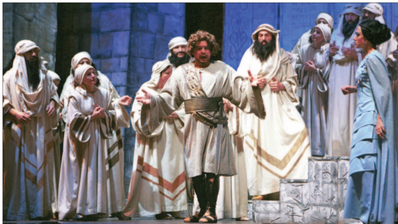
„Die schönsten Opernchöre“ – zu erleben am 24. April im Konzerthaus Karlsruhe

KONZERT: K&K Philharmoniker am 24. April mit K&K Opernchor im Konzerthaus