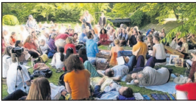
„Woodstock-Gefühle“, in Baden-Baden sollen sie aufkommen

Es zieht Besucher aus ganz Deutschland und den Nachbarländern an: das „Rainbow-Spirit-Festival“. Von Freitag bis einschließlich Pfingstmontag steht im Baden-Badener Kongresshaus alles im spirituellen Rampenlicht. Aussteller, Referenten, Bands und Festivalbesucher wollen im wahrsten Sinne des Wortes gemeinsam in eine andere Welt abtauchen. Viele hoffen dabei auch auf „Woodstock-Gefühle“.