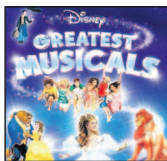
Disneys „Greatest Musicals“-CD

CD-VERLOSUNG: Neues aus der Disney-Musikwelt