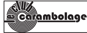
Das „Le Carambolage“-Logo