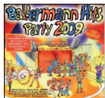
Zwei CDs für Partys in 2009

42 Lieder warten auf die nächste Fete, darunter „Alles neu“ von Peter Fox, „Ra Ta Ta“ von den Mallorca Cowboys feat. Marco Mzee bis Scooters „Jump That Rock (Whatever You Want)“ und „Wickie“ von den Rheinländern. Mickie Krause und Jürgen Drews sind auch verewigt. Mehr: www.emimusic.de . (kert)