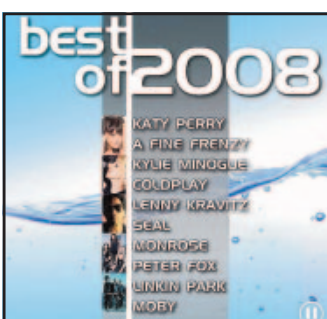
Ein poppiger Doppel-CD-Sampler

Zu den 42 Titeln gehören „Break The Ice“ von Britney Spears, Udo Lindbergs Song „Wenn Du durchhängst“ bis „Disco Lies“ von Moby. Der bunte Musikmix hat für jeden Freund der Charts etwas zu bieten. Die Spanne reicht von Paul Potts, Katy Perry, Mark Medlock, Monroe, Seal, Estelle bis Linkin Park und Fettes Brot. Online mehr Infos: www.emimusic.de . (kert)