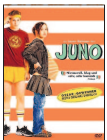
Ein sehenswerter Film: „Juno“

Regisseur Jason Reitman einen unangeregter unkonventionellen Weg: Katastrophe? Ja natürlich! Aber längst kein Drama. Seine Kesse Juno nimmt's wie immer herzlich gelassen: Sie macht im Anschluss an ihre Beichte – als ginge es darum, eine verhaute Mathearbeit auszugleichen – das kinderlose Vorstadt-Ehepaar Mark (Jason Bateman) und Vanessa (Jennifer Garner) als Adoptivelterne ausfindig; zwei Würdige aus der Welt besserer Verdienender Mittdreißiger samt Kühlschrank voll Kräuterlimo und eben beinahe glücklich. Ihr Tic-Tac liebender Boyfriend Bleeker trainiert sowieso mit seinen Jungs, als wäre nur der nächste Wettlauf im Anmarsch; und plötzlich auftauchende Muttergefühle gibt's hier gleich gar nicht. Das „Oscar“-prämierte Dreh-