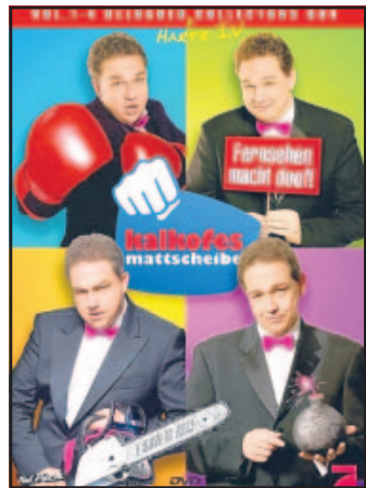
„Kalkofe“-DVD-Box in vier Teilen

DVD: Oliver Kalkofes neue Sammelbox / Verlosung