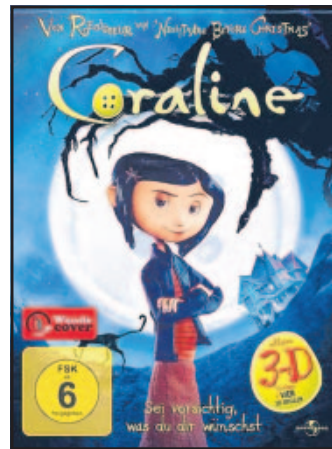
„Coraline“-DVD zum Gruseln

DVD: „Coraline“ im Handel / „Wobla“-Gewinnspiel