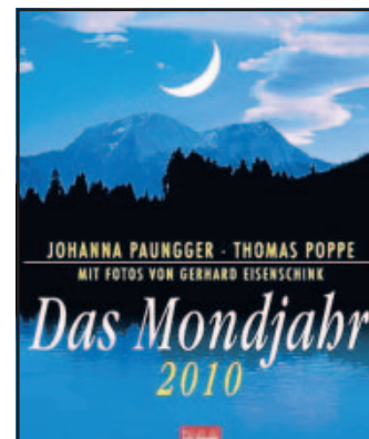
Ein Mondwandkalender 2010

MITMACHEN & GEWINNEN Als Kennwort für die Kalenderverlosung „Schlafwandler“ angeben. Teilnahme